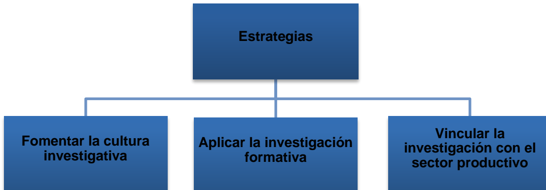
Gráfico 5.4 Estrategias para el desarrollo de la investigación en el nivel de formación Profesional Universitario